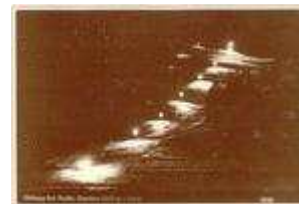
Skifahren bei Flutlicht wurde bereits 1958 in Nauders realisiert! In den fünfziger und sechziger Jahren wurden in Nauders die beliebten Nachttorläufe veranstaltet!