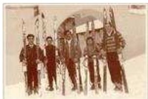
Teilnehmer am Eröffnungsspringen auf der Naudersbergschanz am 21.01.1931!