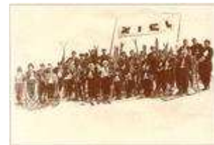
Kinderskirennen am 11.04.1935 auf dem Rossboden, veranstaltet vom Skiclub Nauders!