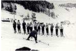
So wurde in den 30er Jahren in Nauders ein Skikurs "zelebriert"! (aufgenommen vor dem Schloss Naudersberg)