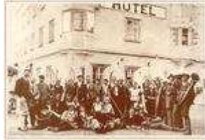
Skifahrer vor dem Hotel Post