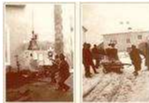
Abschied der Nauderer Glocken 1944. Die Glocken mussten zum Einschmelzen abgeliefert werden. Neue Glocken wurden erst wieder 1957 gegossen und geweiht!