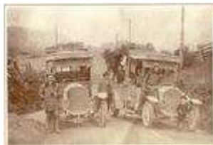
Seit Juni 1910 verkehren fahrplanmässig Postbusse über den Reschenpass!