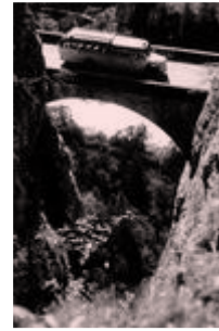
Ein alter Postbus (Saurer Bus) aufgenommen im Jahre 1970 bei der Fahrt nach Nauders (Hochfinsternüz)